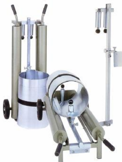
K1-AG + K1-AGb

De afrol- en dwars- en/ of langsnijdinrichtingen zijn optioneel te monteren op iedere DRÄCO-coilwagen. Kan ook gemonteerd worden op een werkbank.