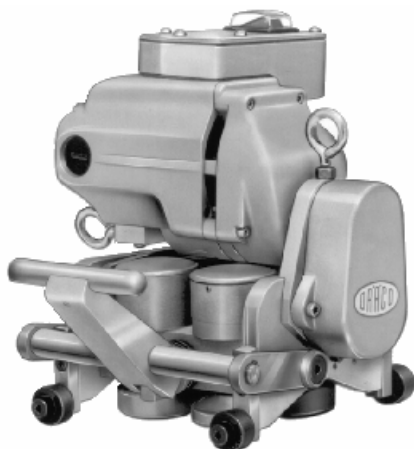
K9-GWS en K9-DSAR